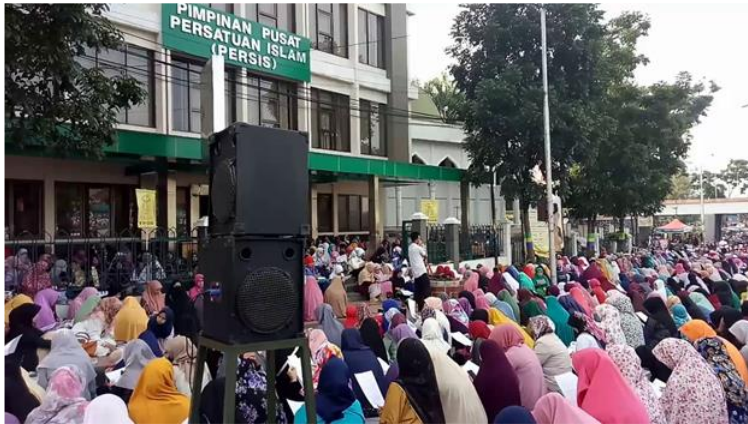
Suasana Pengajian Ahad di Kantor PP. Persis.

Selanjutnya proses kegiatan pelaksanaan pasca pengajian, bagian pengumpulan isi materi pengajian berupa recorder radio and camera disimpan dalam file khusus JIHAD yang kemudian bisa dimodifikasi dan ditransmisikan ke dalam media sosial resmi yang dimiliki Persis, seperti Facebook, Twitter, Instagram, dan Youtube.